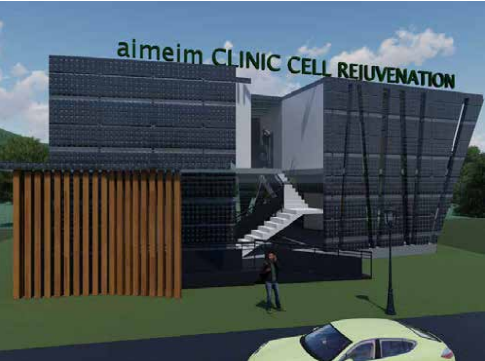
La primera clínica aimeim del mundo para el rejuvenecimiento celular de 10 a 40 años con atención médica y los cinco y el sexto sentido apelando y activando programas individuales de información del sistema aimeim con médicos naturópatas, psicoterapeutas y asesoramiento holístico para la vida.

Otros resultados de investigación, por ejemplo de la ETH de Zúrich en 2014, demuestran que “los pensamientos pueden activar los genes”.