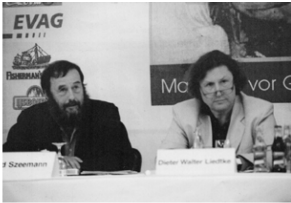
Harald Szeemann y Dieter Liedtke en el Hotel "Vier Jahreszeiten" de Hamburgo para la rueda de prensa de la exposición art open art formula 1999

"El propio Liedtke es una obra de arte. El artista-inventor y Leonardo da Vinci de hoy debe sentirse por muchos en sus exposiciones o directamente con él en entran en contacto. Es energía positiva."