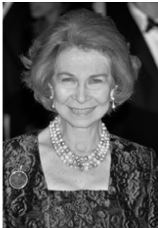
- Reina Sofía de España,