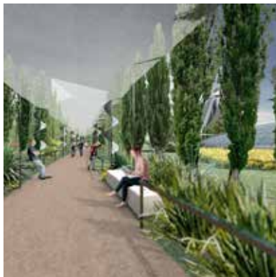
Parque con molinos de bandera energética Piscina de natación natación, relajación y deportes paisaje con cafetería y restaurante.