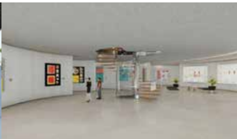
Museo con la zona de exposición Fórmula del Arte