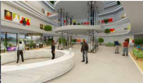
Vestíbulo del ***** Sterne Hotel Innovationsfabrik