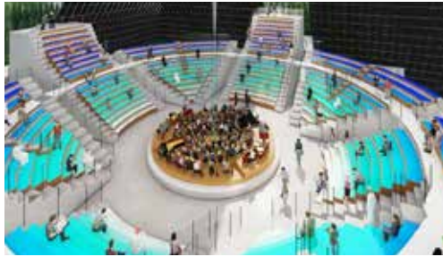
La pirámide de Spirithall como sala de conciertos