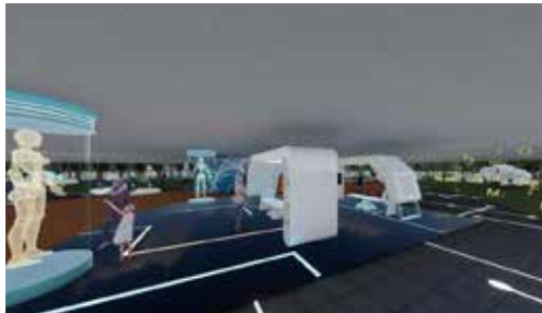
Mercado de la innovación: Salón de actos y mercado de la innovación