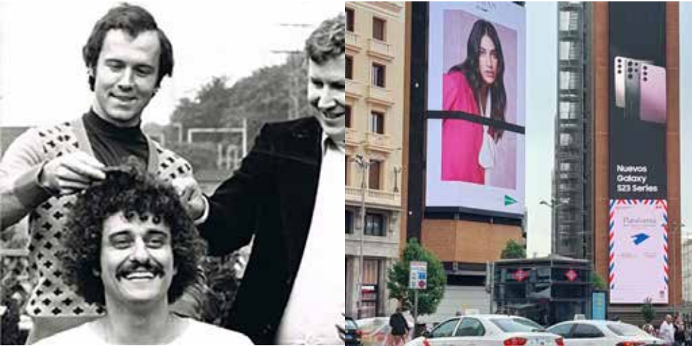
Franz Beckenbauer (izquierda) y Dieter Liedtke cortan el pelo con Hairmatic 2000

A principios de los años setenta, Liedtke inventó la maquinilla de cortar el pelo Hairmatic 2000, de la que vendió millones