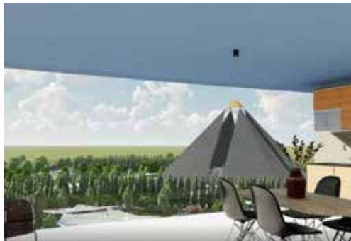
Pisos y villas de lujo Smartloft de los 100 mejores arquitectos e interioristas de principios del siglo XXI como obra de arte total de la arquitectura con autosuficiencia sostenible en agua, clima y energía.