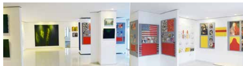
Exposición Museo Liedtke: Arte = Evolución

1994 Inauguración del Museo Liedtke con la exposición Arte = Evolución.