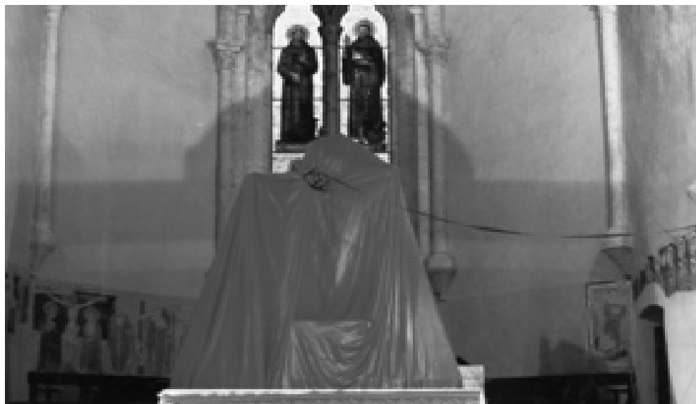
Título de la obra: Information as Time or Timeless Events.

1991 “Cuadros desde la perspectiva de Dios” en la Iglesia de St. Francisco en Gemini/Italia.