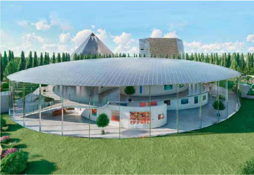
El museo de la evolución de las innovaciones en el arte: una arquitectura que se hace eco de los antiguos rituales celtas La placa craneal de Albert Einstein / El museo cuenta con las siguientes 10 zonas de exposición en 22 000 m2 de interior y exterior: Fórmula Arte: Vida I, Vida II, Física Cuántica + Conciencia, Antes del Tiempo/Dimensión Cuatro = 0, Fórmula Mundo, Redes, Sociedad + Religión, Arte y Curación, y Fórmula A.

La exposición Nefor el desarrollo de las innovaciones en el arte ¿a través de los tiempos. El museo tiene la forma maÇscal de la placa del cráneo de Albert Einstein, bajo la cual las obras de arte simbolizan las sinapsis y las vías las trayectorias de las conexiones nerviosas, haciendo así posible en el cerebro de la historia cultural de la humanidad así como en el cerebro del empleado de la oficina de patentes Albert Einstein rastrear las innovaciones en el arte con la fórmula del arte.