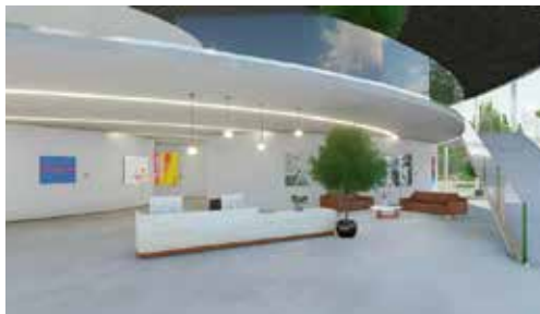
Entrada al futuro lugar de encuentro "Museo"