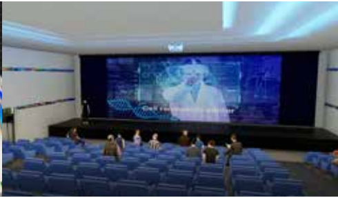
Centro de seminarios y aula de rejuvenecimiento celular aimeim combina los antiguos rituales de Stonhenge con la epigenética y la música